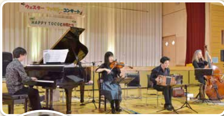
すばらしい演奏を聞かせてくれた4人