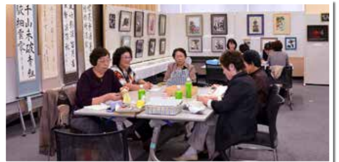
手前は、「和紙ちぎり絵サークル」の皆さんの実演コーナー、奥側は「西部きりえ会」の皆さんの実演コーナー。素晴らしい出来栄えに見学者が引きも切れません。

各展示会場とも各サークルの皆さんの力作ぞろいで、来場者の皆さんからとても好評を得ました。