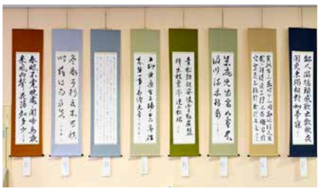
3F ロビーに展示された見事な存在感の掛け軸は、「書楽会」の皆さんの作品集です