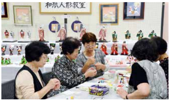
人気の「和紙人形教室」サークルの皆さんは、実演コーナーで紙人形作りの手ほどき中です。

各会場では日頃のサークル活動成果が展示され、芸能発表会場では様々な芸能活動が発表されました。