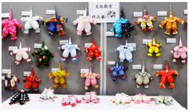
婦人会「文化教室」の手作り人形の作品集、一枚のハンカチからこのような可愛い人形を作り上げます。